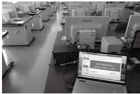
栃木県の県立高校にて「ITとアクセシビリティ(※)」をテーマに、講話や実習を行うなど、地域貢献活動にも力を入れている

(株)スカイフィッシュはそのソフトウェア開発技術もさることながら、掲げる企業理念「情報格差の解消」が素晴らしいと感じています。ページめくりも口頭説明もすべてOKというソフトはユニークです。合成音声ソフトウェアという分野は「たくさんの人々に平等にサービスを提供する」という機能を持っています。「誰もが平等に製品、サービス、情報を利用できる」ソフトづくりは必要です。頑張ってください。