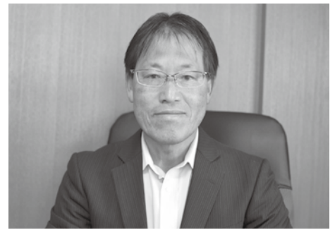
「情報格差の解消をめざす」と話す大塚社長